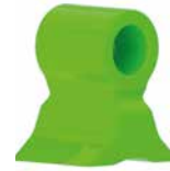
MAZHF11/13 Ø MAX 25 CM