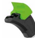
DFHF15 Ø MAX 20 CM