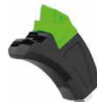
DFHF14 Ø MAX 25 CM