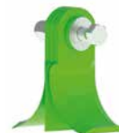
COLTKF7 Ø MAX 6 CM